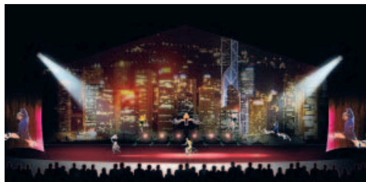
Un plateau de 200 mètres carré et 120 artistes. ■ DRAGONE 2007

Enfin, c'est également pour le même groupe Melco-PBL que Franco Dragone créera en 2009 un spectacle permanent au cœur de "City of Dreams", un nouveau et luxueux complexe hôtelier qui verra le jour prochainement à Macao. ■ B