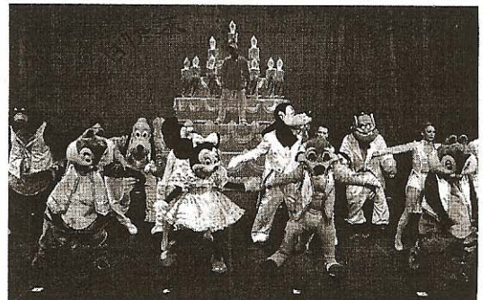
Dix ans plus tard, la magie Disney est toujours là.