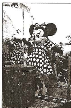
Minnie se fait belle avant de rejoindre le plateau de la Disney cinéma parade... VD CE40632