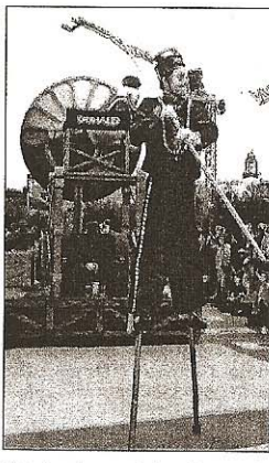
Avec les grooms-échantillonniers, on retrouve la griffe tournaisienne dans