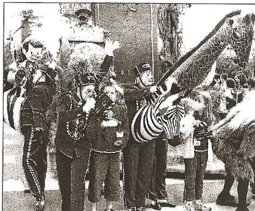
Le lion n'est pas appelé à rendre activement part à certains